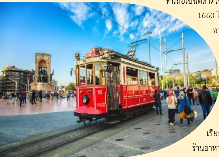
ของชาวเมืองอิสตันบูล

ร้านอาหารพื้นเมือง และยังมีแตรมโบรราณ (Tram) เรียกได้ว่าที่แห่งนี้เป็นจุดนัดพบยอดนิยม